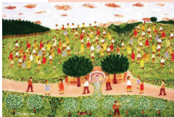
Πρωτομαγιά, Έργο του Γιώργου Ρήγα

Ο Γιώργος Ιωαν. Ρήγας (1921-2014) γεννήθηκε στο χωριό Ζωριάνος, όπου έζησε τα νεανικά του χρόνια και στη συνέχεια έζησε στην Αθήνα διατηρώντας τη σχέση του με τον τόπο καταγωγής του. Είναι αυτοδίδακτος λαϊκός ζωγράφος του οποίου το έργο εμπνέεται από αναμνήσεις και προσωπικά του βιώματα από τη ζωή, αλλά και από έθιμα του χωριού του, τις γιορτές, τις εκδηλώσεις και τις δραστηριότητες των κατοίκων του και γενικότερα από εικόνες της ορεινής υπαίθρου, όπως αυτός τις έζησε. Τα έργα του έχουν εκτεθεί σε μουσεία, γκαλερί και διάφορους άλλους χώρους τέχνης τόσο στην Ελλάδα, όσο και στο εξωτερικό. Ατομικές εκθέσεις έχει κάνει σε πολύ σημαντικά μουσεία όπως στα Neue Galerie και Sammlung Ludwig του Άαχεν στο Stadtmuseum του Ντίσελτορφ, στο Musée d'Art Naif – Musée Max Fourny στο Παρίσι, στην C.Grimaldy Gallery της Βαλτιμόρης στο πλαίσιο της Outsider Art Fair στη Ν. Υόρκη το 2012. Οι «New York Times» αναφέρθηκαν το 2012 στον Γιώργο Ρήγα ως έναν αυθεντικό λαϊκό ζωγράφο, παρομοιάζοντάς τον μάλιστα με τη διάσημη και περιζήτητη Αμερικανίδα λαϊκή ζωγράφο Grandma Moses.