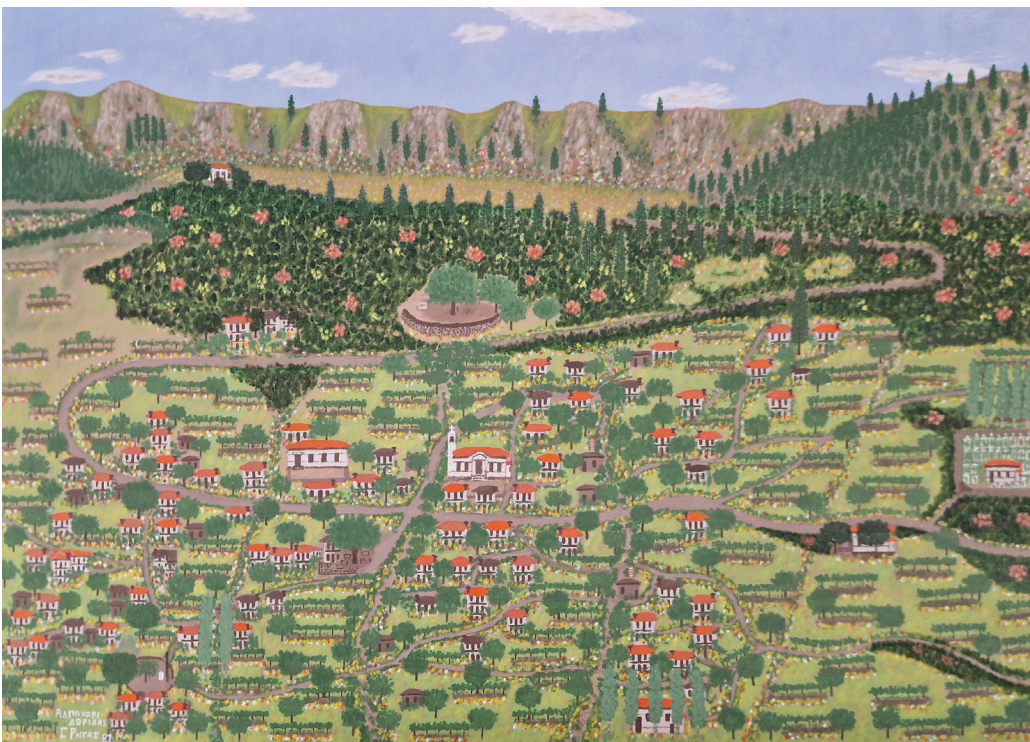
Αλποχώρι, έργο του Γιώργου Ρήγα

Ύστερα από αυτή τη σύντομη αναδρομή προτείνω από φέτος ο Δήμος μας να συμμετάσχει ενεργά στη διατήρηση της παράδοσης αυτής με σχετική διαφήμιση και συμμετοχή. Για το σκοπό και τη συμμετοχή μας αυτή θα χρειαστεί ανάλογη πίστωση την οποία και παρακαλώ να ψηφίσει το Δημοτικό Συμβούλιο σε βάρος του Κ.Α 062.3 του προϋπολογισμού των εξόδων του Δήμου μας.