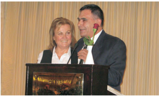
συνέχεια από τη σελ. 1

από εκεί στο Αλποχώρι τα μετέφερε δωρεάν ο Θύμιος Σπυρόπουλος.